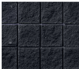
プレシャスブラック