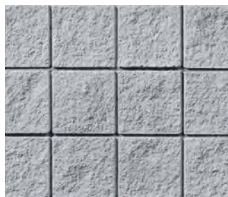
プレシャスホワイト