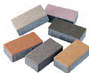
ノーマルインター 透水性インター etc

白色セメントを一部使っている商品もありますが、今のところ安定供給可能です。詳しくはお問い合わせください。