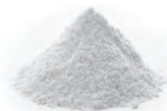
高炉スラグ微粉末

アルティマテクノロジーとは高炉スラグ微粉末を結合材に用いる技術です。従来のコンクリート製品に比べ、CO 2 の排出削減を実現。また、白色セメントと同様に 明るいカラー を出すことができます。